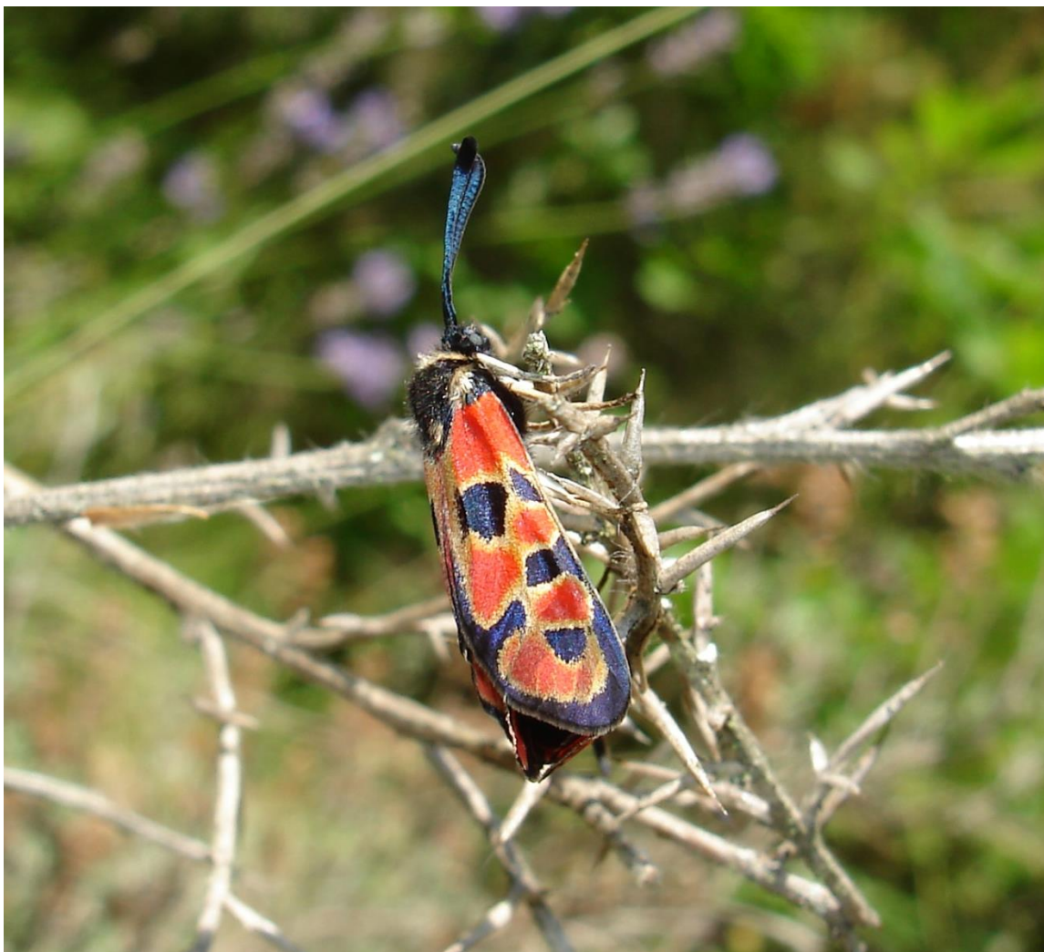
Zygaena hilaris , Lantosque, Alpes-Maritimes, 7 juillet 2012.