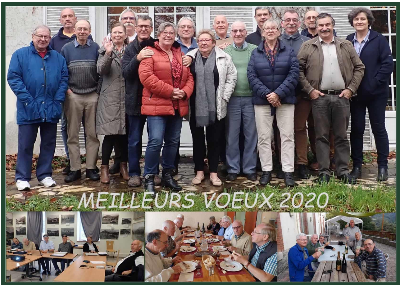
Les membres du GIRAZ-Zygaena réunis le 8 décembre 2019, en haut et le 21 septembre 2019, en bas.