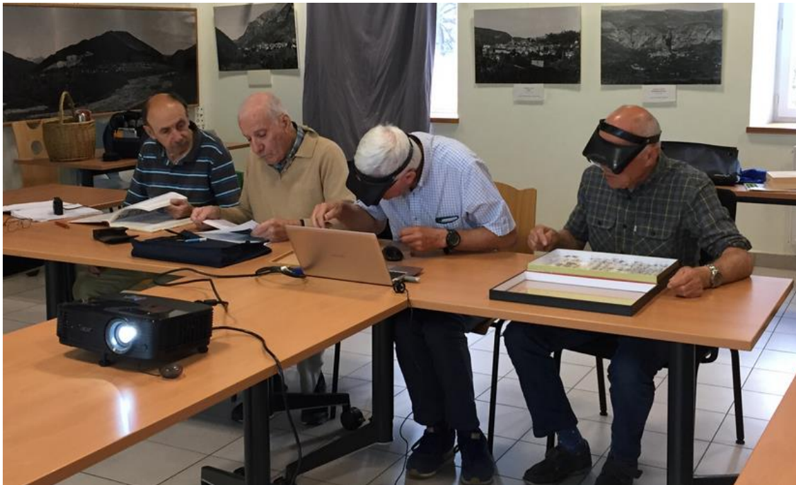
Tout le monde est concentré sur le travail ce 21 septembre 2019