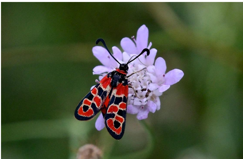
Zygaena fausta , une visiteuse des sarriettes de Séolane à Barcelonnette. (La photo n'a pas été prise à cet endroit)